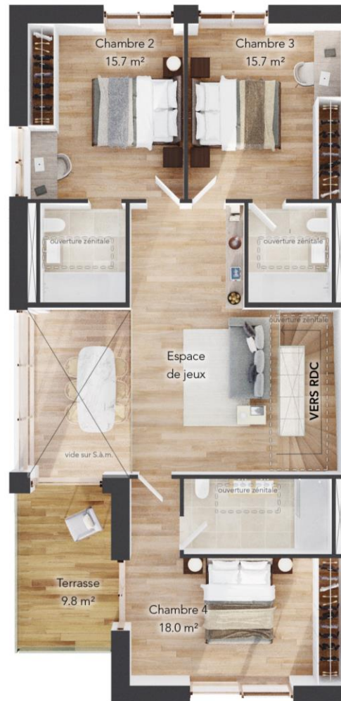
1 ER ETAGE