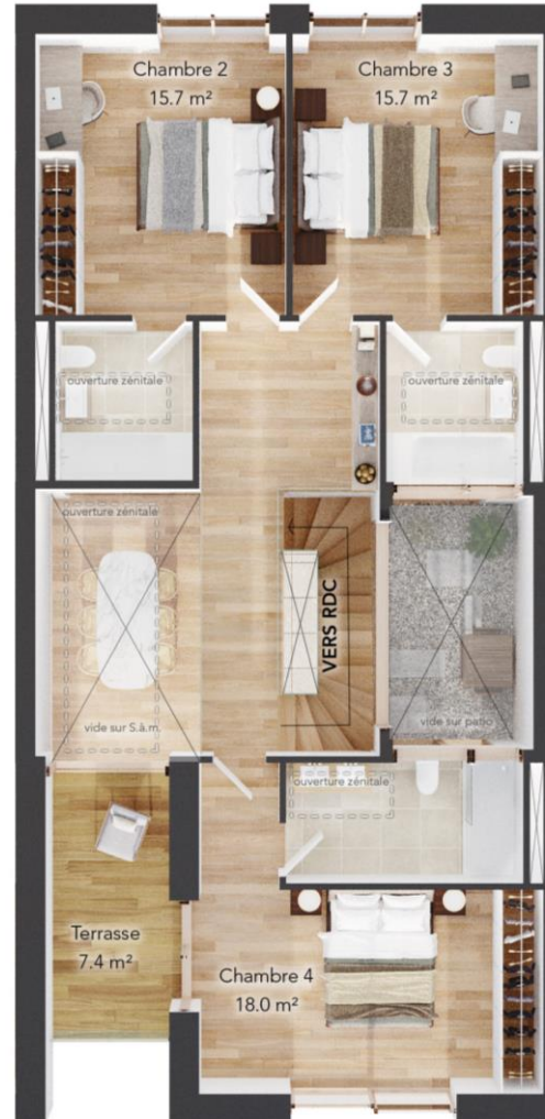
1 ER ETAGE